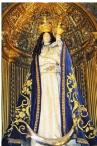
Imaculada Conceição, de

No próximo dia 29 de novembro, começa, na vida da Igreja, a novena preparatória da solenidade da Imaculada Conceição da Virgem Santa Maria, que se celebra no dia oito de dezembro, dia santo de guarda, em que os cristãos têm o dever de participar na Missa inteira e abster-se dos trabalhos servis.