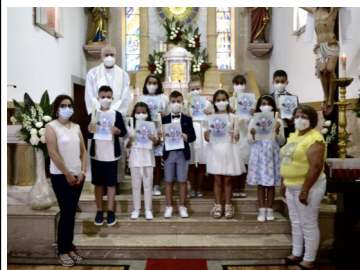
Crianças do 4º ano e respetivas catequistas.

No passado dia quatro de julho, na igreja paroquial de S. Bartolomeu do Mar, dez crianças que, no passado ano de catequese, frequentaram com assiduidade e aproveitamento, o terceiro ano, celebraram a Festa da Eucaristia, também conhecida pela festa da Primeira Comunhão. A elas juntaram-se nove crianças que frequentaram o quarto ano.