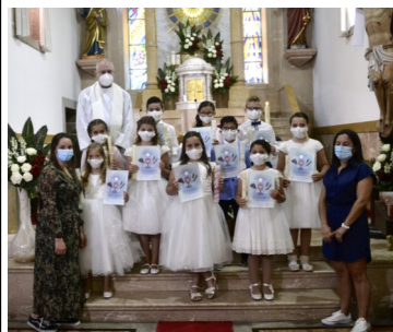
Crianças do 3º ano e respetivas catequistas.