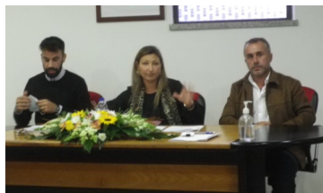
Mesa da Assembleia de Freguesia da União