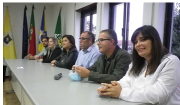
Restantes membros da Assembleia de Freguesia da União

No dia 16 de outubro, no salão nobre da sede da Junta, em Belinho, decorreu a instalação dos membros eleitos para a Assembleia de Freguesia da União de Freguesias de Belinho e Mar. A assembleia aprovou a proposta para o executivo da Junta de Freguesia.