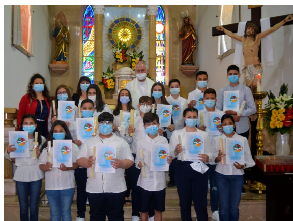
Adolescentes do 7º ano e suas catequistas

mo ano, que não puderam celebrar a Festa da Fé no ano passado devido à pandemia COVID-19.