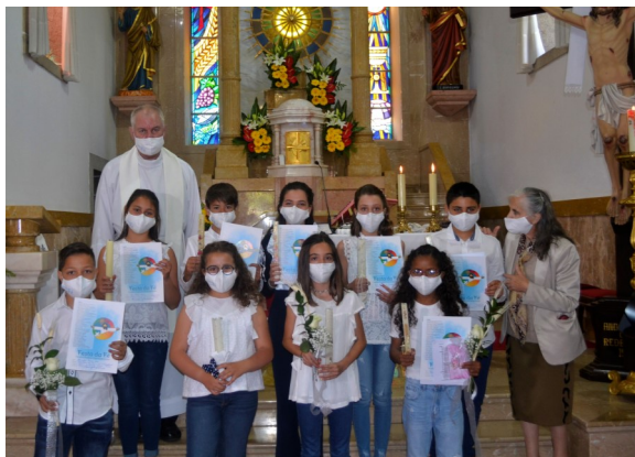
Crianças do 6º ano e sua catequista