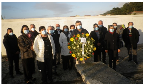
Romagem ao cemitério de Mar em homenagem aos nascidos em 1956 e já falecidos