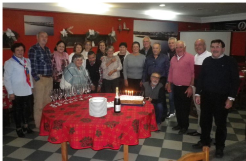
O grupo dos nascidos/residentes em Mar, em 1956