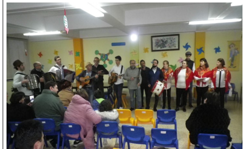
Com o apoio da Comissão de Festas da Romaria, o Grupo de Janeiras de Mar assegurou a animação da tarde.

A Caminhada pelos Presépios marcada para esse mesmo dia, não se realizou devido às condições adversas do tempo.