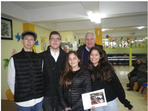
O Grupo de Jovens Shalom assegurou o Presépio da Igreja Paroquial

Nesta 16ª edição, foram 67 os presépios construí-