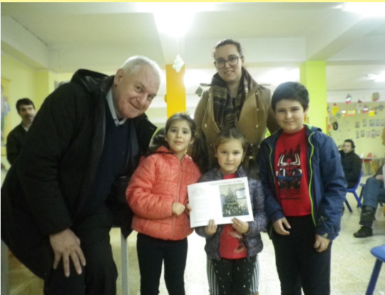
O Centro Social de Mar entregou 67 Certificados.