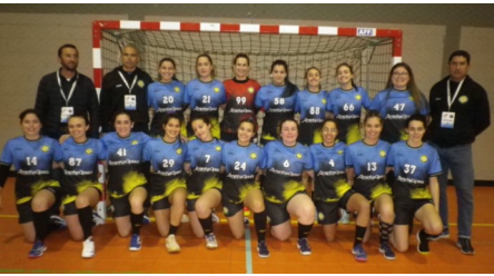
Equipa de Seniores de Andebol da Juve Mar