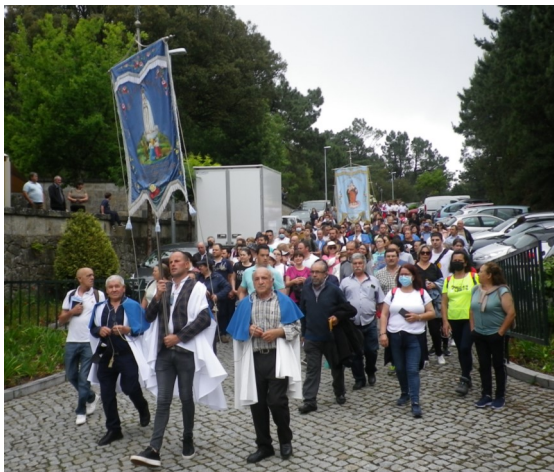
A paróquia de S. Bartolomeu do Mar, a exemplo dos anos anteriores, marcou forte presença na peregrinação de 2022.