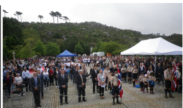
As autoridades locais e municipais marcaram presença no evento que reuniu centenas de pessoas.

Depois deixou um apelo, seguindo as palavras do Papa Francisco na encíclica "Cuidar da Casa Comum" para cada um se embeber "na beleza da criação". Salientando que "cada um tem o seu próprio caminho", realçou: "deixemo-