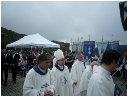
D. José Cordeiro, Arcebispo Primaz de Braga, presidiu às cerimónias da Peregrinação à Senhora da Guia, em Belinho.

Organizada pelas paróquias de Palmeira e Curvos, a peregrinação contou com a presença de todas as paróquias do arciprestado de Esposende e de muitos peregrinos que, pelas 10 horas da manhã, arrancaram, a pé, e com a presença de D. José Cordeiro, rumo ao cimo do monte da Senhora da Guia. Liderada pelo Agrupamento Nº 82, dos Escuteiros de Mar, a peregrinação contou com um número muito grande de peregrinos de S. Bartolomeu do Mar.